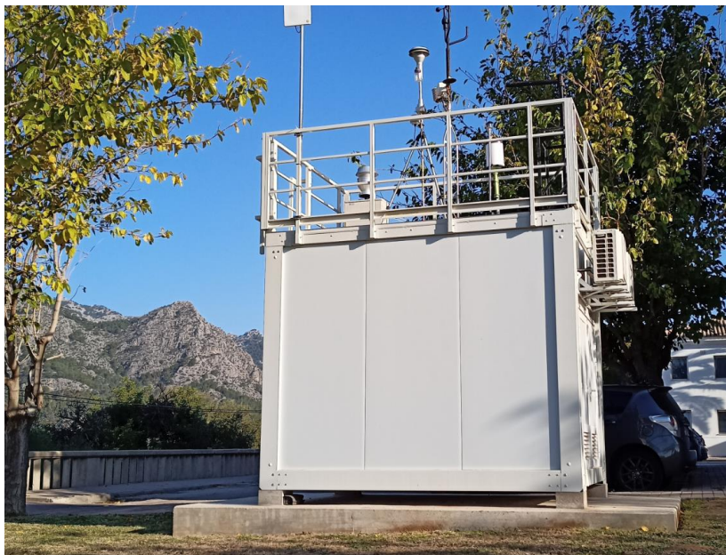
Imagen de la cabina fija ubicada en el Hospital Joan March (Caubet, Bunyola)

TIRME posee la gestión de dos cabinas de control de calidad del aire. Una de ellas es una cabina fija ubicada en el Hospital Joan March (Bunyola) y la otra cabina es un furgón móvil que se traslada de manera bimestral alternativamente a tres poblaciones circundantes a las instalaciones de la Zona 1: Son Sardina, Es Garrovers y Palmanyola.