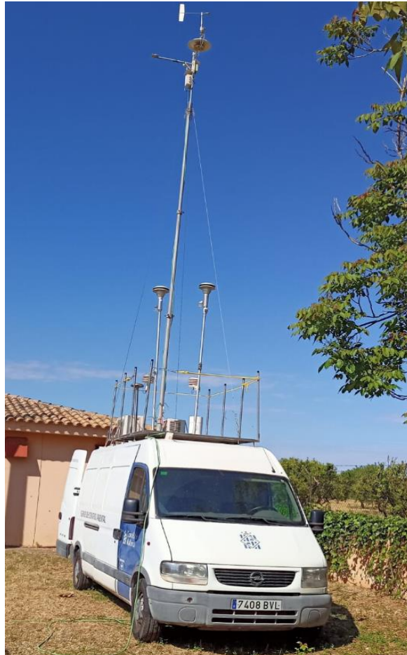
Imagen de la cabina móvil en la localización de Son Sardina (Palma)

Para realización de campañas manuales TIRME posee tres captadores MCV de alto volumen modelo CAV-A/mb, con tres cabezales de la misma marca modelos PM1025/CA (PM10) y dos cabezales de PM1025/UNE (PM2.5) adquiridos en el año 2010. Adicionalmente se dispone de un captador de impactador de cascada.