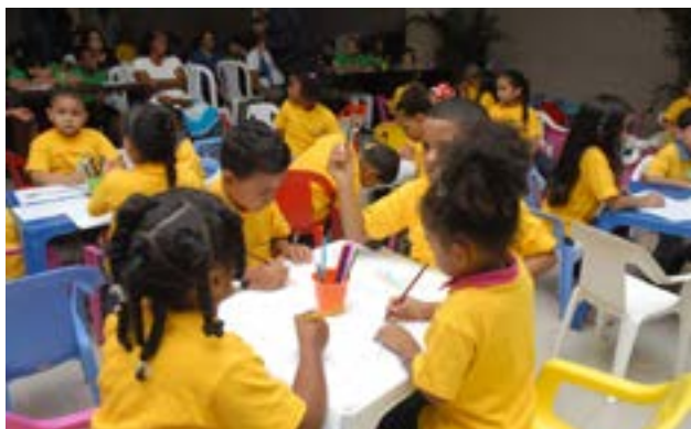
Los niños participaron de diversas actividades organizadas por la Comisión de Medio Ambiente y Deportes del COD.

La Comisión Mujer y Deporte del Comité Olímpico Dominicano celebró la Segunda Jornada Ambiental Verano 2013, en la que participaron decenas de niños de diferentes edades.