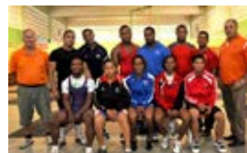
Parte de los pesistas clasificados a los juegos de Veracruz junto a sus entrenadores.

La República Dominicana ha logrado 58 plazas en 11 deportes para los Juegos Centroamericanos y del Caribe que se celebrarán el próximo año en Veracruz, México.