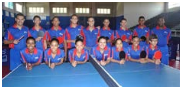
Selección nacional femenina de tenis de mesa.