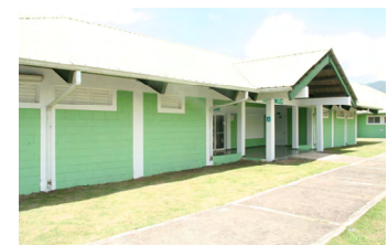
Instalaciones de Remo y Canotaje en la presa de Rincón, Sabana del Puerto.

La Federación Dominicana de Remo y Canotaje, (Fedoreca) anunció la celebración de una jornada de reforestación y siembra de 1500 árboles de distintas especies en el entorno de las instalaciones