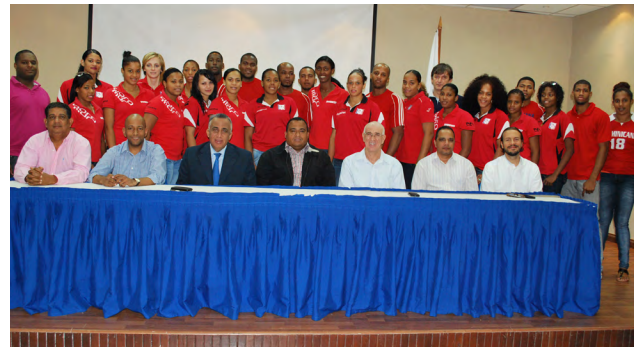
Las selecciones masculina y femenina fueron presentadas en rueda de prensa en el Comité Olímpico Dominicano.

Un total de ocho equipos estarán buscando su pase a los Centroamericanos de México, entre los que se encuentran Cuba, Puerto Rico, Colombia, Venezuela, Haití, México, República Dominicana y Guyana, como invitado.