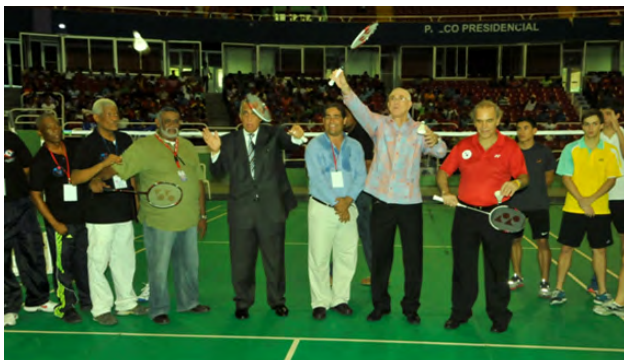
Momento de la ceremonia de apertura el pasado lunes.

El XVIII Campeonato Panamericano de Bádminton Superior quedó inaugurado el lunes y se extenderá hasta el 31 de este mes en el Palacio de los Deportes Don Virgilio Travieso Soto.