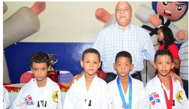
Parte de los medallistas de la representación de San Francisco de Macorís.

El seleccionado de San Francisco de Macorís se coronó campeón masculino y femenino del Octavo Torneo Nacional de Tae Kwon Do infantil y juvenil, celebrado en esta ciudad bajo la organización del Mora Tae Kwon Do Club y avalado por la Federación Dominicana de esa disciplina.