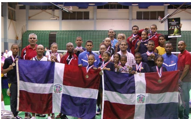
Selección Dominicana de Bádminton, campeones del Campeonato Centroamericano y del Caribe, CAREBACO 2013, en Puerto Rico con sus 27 medallas.

La Selección Dominicana de Bádminton ratificó por segundo año consecutivo el título de campeones del Campeonato Centroamericano y del Caribe (CAREBACO 2013) arrasando con 27 medallas, 10 de oro, 8 de plata y 9 de bronce, para un total 183 puntos, en el evento que desarrolló en el coliseo Pedrín Zorrilla de Hato Rey, Puerto Rico.