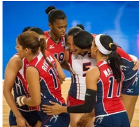
Las voleibolistas del equipo de República Dominicana celebran el triunfo del equipo ante Costa Rica.

a Costa Rica en el Grupo A en el inicio del Torneo Continental NORCECA de Voleibol de Mayores Femenino donde se disputa una plaza para la Copa del Mundo en Japón que organiza la Federación Internacional de Voleibol.