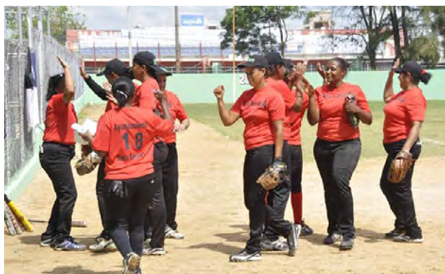
Un equipo celebra en la copa Juan Pablo Duarte de Softbol.

San Juan en femenino y Azua en masculino, del Sur Corto, completaron los ocho conjuntos clasificados por regiones en la II Copa Juan Pablo Duarte de Softbol que organiza la Federación Dominicana de Softbol (Fedosa).