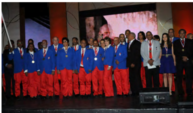
El nutrido grupo de deportistas de los XII juegos recibieron medallas al mérito en la Gala Olímpica.

Con el segmento denominado “Héroes de los XII Juegos”, el Comité Olímpico Dominicano (COD) conmemoró el 40 aniversario de la celebración en el país de los XII Juegos Centroamericanos y del Caribe.