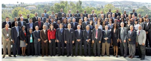
La foto oficial del evento en la que figuran los delegados de las diferentes naciones asociadas a la Norceca.