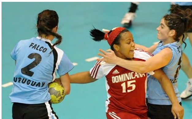
El torneo de balonmano Copa del Caribe es el principal evento de la región.

Los seleccionados de Cuba, Colombia, Venezuela, Puerto Rico, Haití y México ya se encuentran en el país para participar en la Copa del Caribe de Balonmano, evento que se inicia este miércoles, 6 de noviembre, en el bajo techo del Parque del Este. La República Dominicana estará presente con dos equipos, uno masculino y otro femenino.