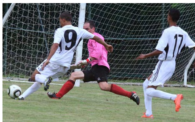
Un momento de acción del partido amistoso celebrado entre un seleccionado dominicano y otro de la fragata HMS Lancaster de Gran Bretaña.