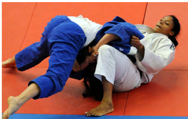
Una pareja de judoca durante un combate.

La Federación Dominicana de Judo (Fedojudo) celebrará en el país la Copa Panamericana de ese deporte los días 17 y 18 de este mes de enero en las categorías sub-18 y sub-21.