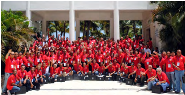
Dirigentes de las 38 Federaciones Deportivas Nacionales participaron del séptimo Encuentro Nacional de la Dirigencia Deportiva Olímpica.

BOCA CHICA. En el interés de mantener los parámetros establecidos, el movimiento deportivo olímpico hizo un vehemente llamado al Gobierno para que se establezca una política deportiva concreta de mediano o largo plazo.