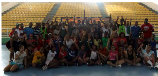
Directivos de la federación de balonmano, junto a los nuevos talentos.

La actividad de este fin de semana se realizó con nuevos valores provenientes de las provincias Bayaguana, La Vega, San Juan de la Maguana, La Romana, Santo Domingo y el Distrito Nacional, los cuales serán integrados al proyecto juvenil.