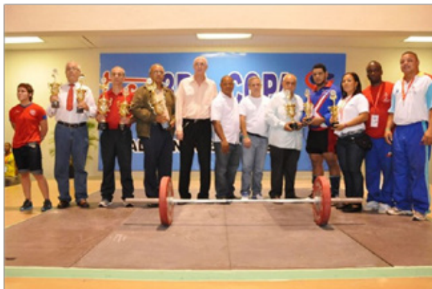
Ganadores de los primeros lugares por equipo junto a dirigentes de la Confederación Panamericana y la Federación Dominicana de Pesas y del Comité Olímpico Dominicano.

el pabellón José Joaquín Puello, del Parque del Este.