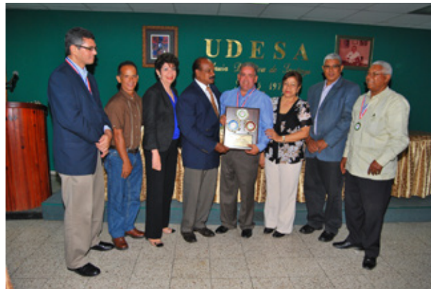
Una de las premiaciones de los juegos de Santiago.

La zona Norte fue segundo con 940 medallas de oro, 285 de plata y 164 de bronce, para una suma de 1,389 preseas, ganó en siete disciplinas, son ellas, atletismo, boxeo, ciclismo, duatlón,