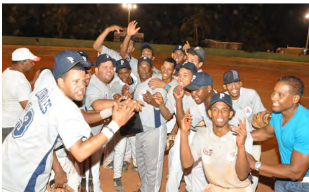
El seleccionado de Pedernales, campeón del torneo de softbol chata.

Los juegos son organizados por el Comité Olímpico Dominicano conjuntamente con las Uniones Deportivas de Montecristi, Dajabón, Pedernales, Jimaní y Elías Piña. 🇩🇴