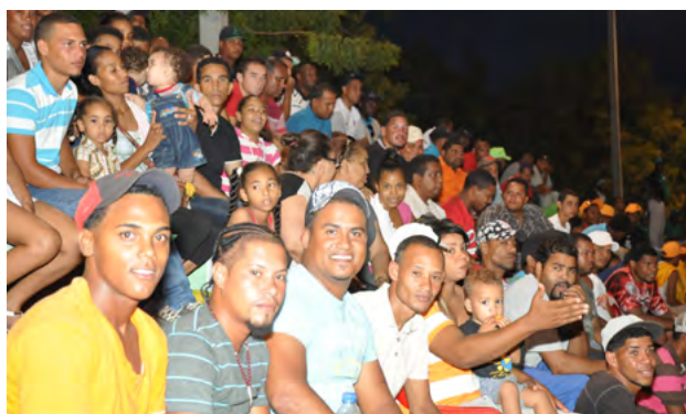
En Pedernales, el público acudió en masa a las diferentes competencias.