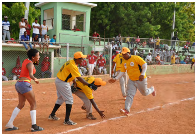
Los atletas viven eufóricamente todas y cada uno de los momentos de sus respectivas competencias. Aquí jugadores de Dajabón celebran un jonrón que conectó uno de los jugadores en el torneo de softbol en la modalidad chata.