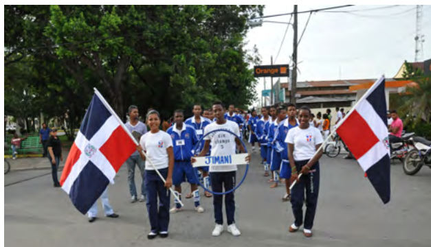
La provincia Independencia ocupa el segundo lugar de los juegos.