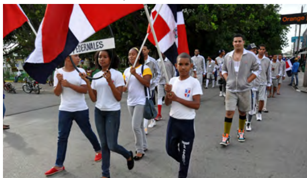
Pedernales tuvo una gran recuperación como sede de los Juegos Fronterizos.

Los juegos son organizados por el Comité Olímpico Dominicano conjuntamente con las Uniones Deportivas de Montecristi, Dajabón, Pedernales, Jimaní y Eliás Piña.