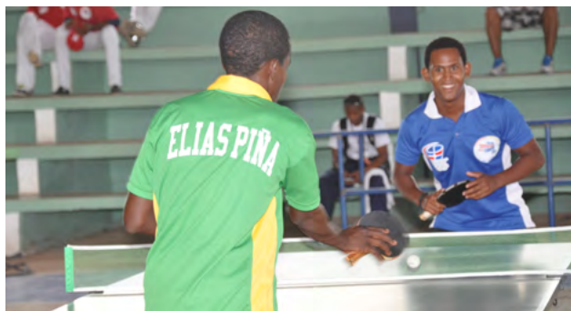
Eliás Piña y Montecristi, en uno de los partidos correspondiente al torneo de Tenis de Mesa en la rama masculina.