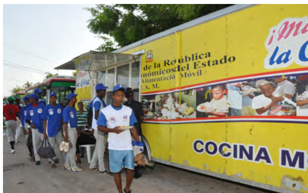
Los Comedores Económicos han sido un gran soporte a los Juegos Fronterizos con el suministro de la alimentación a los atletas, técnicos y dirigentes.