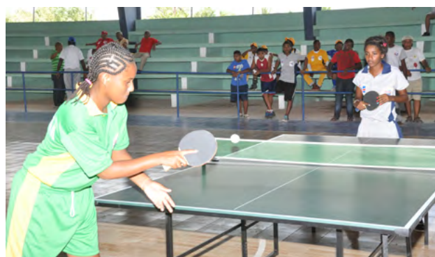
Acción de uno de los partidos entre Pedernales y Jimaní del tenis de mesa femenino.