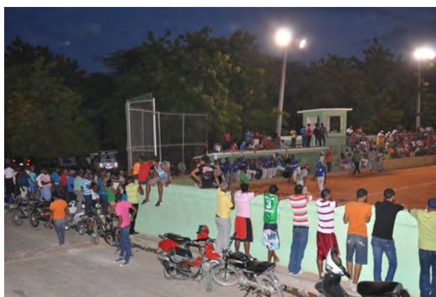
Una gran cantidad de personas siguió paso a paso todas las competencias de la tercera etapa de los Juegos Fronterizos "Polón Muñoz", como se observa en esta foto correspondiente a un partido de softbol.