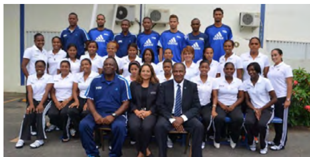
En el curso participan un total de 25 nuevos técnicos.

Con una nutrida participación de alumnos y alumnas se inició un curso especial para nuevos técnicos del fútbol femenino con el auspicio de la FIFA y la Federación Dominicana de Fútbol.