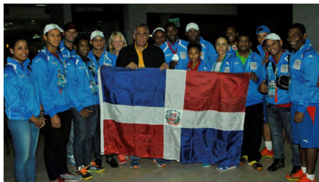
La delegación dominicana que participó en los Juegos Olímpicos de Nanjing.

Con el deseo de seguir trabajando para desarrollar sus carreras, la delegación juvenil dominicana arribó al país tras obtener dos medallas en los recién concluidos segundos Juegos Olímpicos de la Juventud que se celebraron en Nanjing, China. La representación criolla se adjudicó una plata y un bronce,