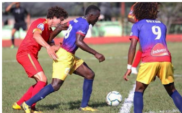
Los partidos de la LDF se celebraron en varias sedes.

revese, mientras que el Atlético Vega Real cae por primera vez y pierde su invicto, luego de tres victorias.