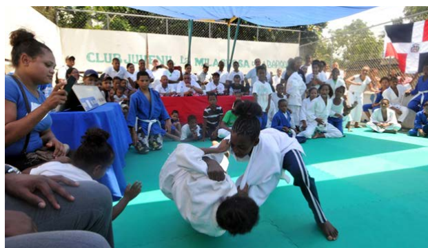
Uno de los combates realizados durante la apertura de la escuela de judo del sector La Barquita como parte del programa “Semillero Olímpico” que realiza el COD en el sector.