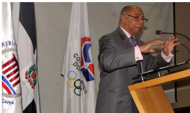
El magistrado Milton Ray Guevara, durante su participación en la conferencia magistral con motivo del 70 aniversario del COD.

A juicio del presidente del Tribunal Constitucional de la República, magistrado Milton Ray Guevara, la cultura y el deporte es uno de los cinco derechos de trascendencia social y catalogó como un hecho de gran importancia la Carta Sustantiva de 2010 que constitucionaliza estos elementos.