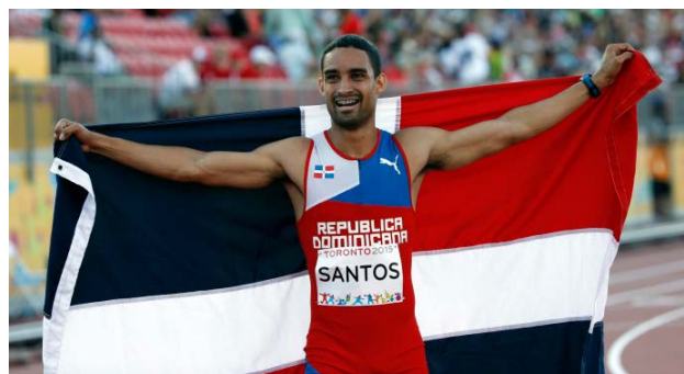
El velocista Luguelin Santos ganó medalla de plata en Londres 2012.

El velocista Luguelin Santos fue escogido como el abanderado de la delegación de República Dominicana que asistirá a los Juegos Olímpicos de Río de Janeiro.