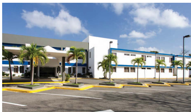
Parte frontal del Albergue Olímpico.

El Albergue Olímpico Dominicano será inaugurado el próximo lunes, en el marco de un acto que será encabezado por el excelentísimo presidente de la República, licenciado Danilo Medina Sánchez.