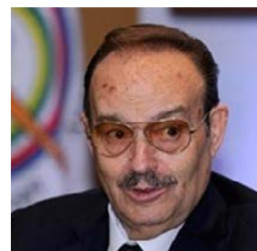
Mario Vázquez Raña

El Comité Olímpico Dominicano (COD) expresa su más profundo pesar por el sentido fallecimiento del dirigente olímpico mexicano don Mario Vázquez Raña, quien murió a los 82 años.