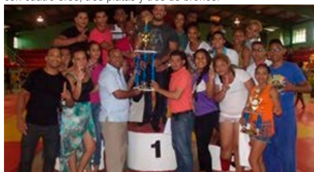
Gilberto García, presidente de la Fedojudo, premia a los atletas y dirigentes de la Zona Norte II, campeona del evento.

El segundo lugar general quedó en manos de la Zona Sur IV, al finalizar con siete medallas de oro, ocho de plata y cinco de bronce. Los judocas sureños ocuparon el primer puesto en la categoría junior, con cinco preseas doradas, igual cantidad de plata y una de bronce, así como el segundo peldaño en cadete, con cuatro oros, tres platas y tres de bronce.