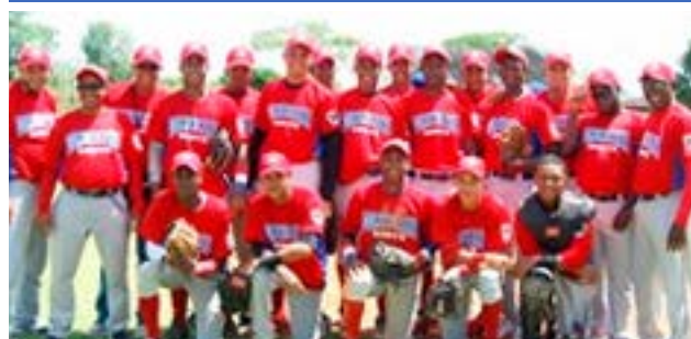
El equipo que representará al país en Dallas.

La República Dominicana Norte y Puerto Rico clasificaron para la Serie Mundial del Programa RBI, que se disputará en Dallas, Texas, Estados Unidos.