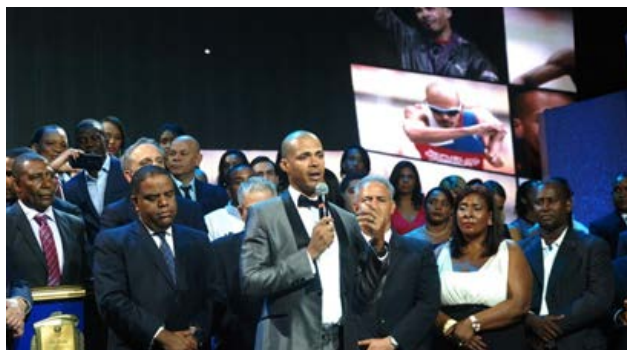
Félix Sánchez, doble medallista de oro en Juegos Olímpicos, tuvo emotivas palabras al recibir la distinción.

Por sus logros en Juegos Olímpicos y en campeonatos mundiales, Félix Sánchez recibió un reconocimiento especial, durante la Gala Olímpica del Comité Olímpico Dominicano (COD) que se celebró este martes en el Salón La Fiesta del Hotel Jaragua.