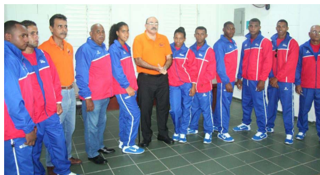
La selecciones de Remo y Canotaje.

La FEDORECA coordina con los Distritos Escolares de Bonao y La Vega, la celebración de jornadas, conferencias promocionales y días de campo con talentos estudiantes de las edades de 14-16 años para insertarlo en el Remo y Canotaje.