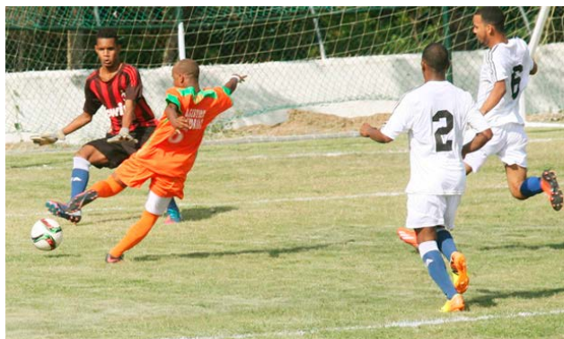
Acción del partido celebrado en el Estadio Panamericano entre los oncenos Bayaguana y San Cristóbal.