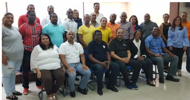
Directivos de la Fedogim y miembros de las distintas asociaciones que se dieron cita a la asamblea ordinaria de la entidad.

SANTO DOMINGO. El comité ejecutivo de la Federación Dominicana de Gimnasia (Fedogim) asumió como un compromiso los XIV Juegos Nacionales Hermanas Mirabal durante la asamblea ordinaria de rendición de cuentas de la entidad celebrada el domingo en el salón Juan Ulises García Saleta del Comité Olímpico Dominicano (COD).