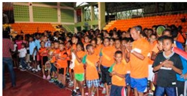
Decenas de niños de diferentes puntos del país, durante la ceremonia de apertura del evento.