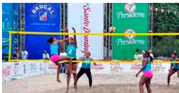
Un momento de acción del torneo de voleibol playero.