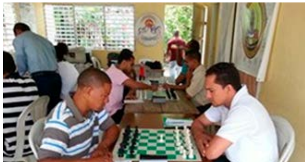
Una de las rondas donde se jugaron varias partidas.