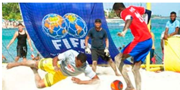
Un Momento de acción del partido final del torneo de fútbol playa celebrado en Juan Dolio.

JUAN DOLIO, SAN PEDRO DE MACORÍS. El conjunto de Los Lobos del Este, Santo Domingo, logró el título de campeón en la VI edición del Torneo Nacional Fútbol Playa que organiza Federación Dominicana de Fútbol (Fedofútbol).