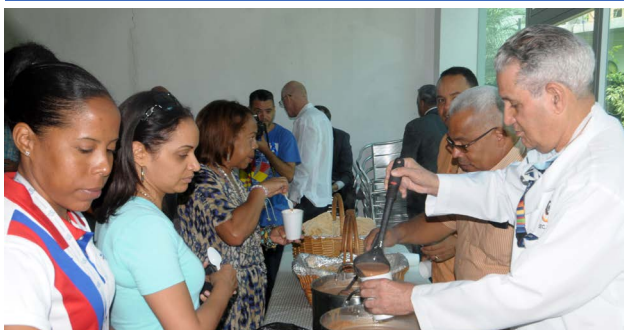
Dirigentes olímpicos y empleados degustan la tradicional habichuelas con dulce.

Como cada año, el Comité Olímpico Dominicano (COD) celebró el tradicional encuentro de Semana Santa con la degustación de unas habichuelas con dulce.