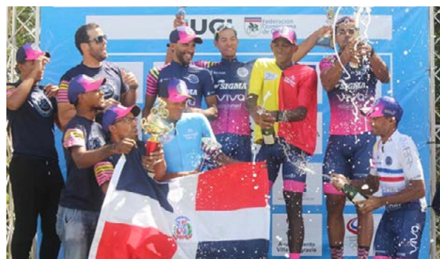
Los integrantes de Aero Cycling Team que conquistó la clasificación general por equipos rosean champagne tras ser premiados como los grandes ganadores.