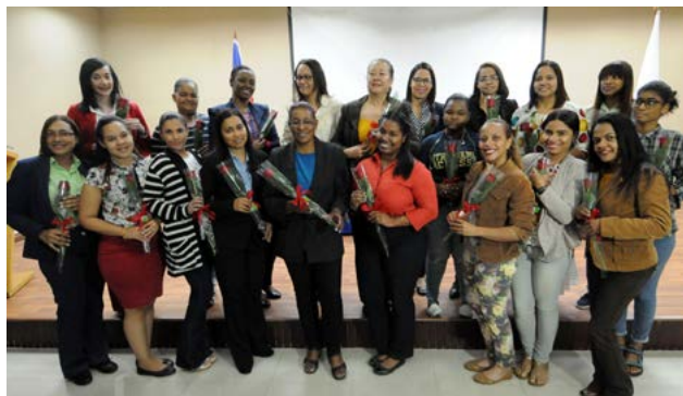
Las damas empleadas del COD, en el agasajo con motivo del Día Internacional de la Mujer.