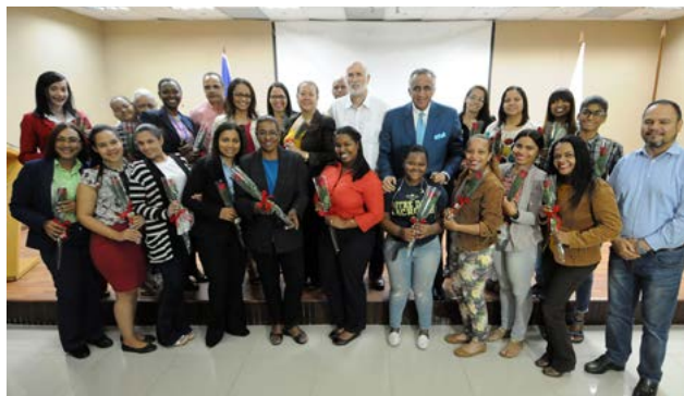
Miembros del Comité Ejecutivo del COD, junto a las empleadas del organismo olímpico en ocasión del Día Internacional de la Mujer.

Miembros del comité ejecutivo del Comité Olímpico Dominicano (COD) llevaron a cabo un emotivo encuentro en honor a las empleadas del organismo olímpico en ocasión de celebrarse este jueves el Día Internacional de la Mujer.