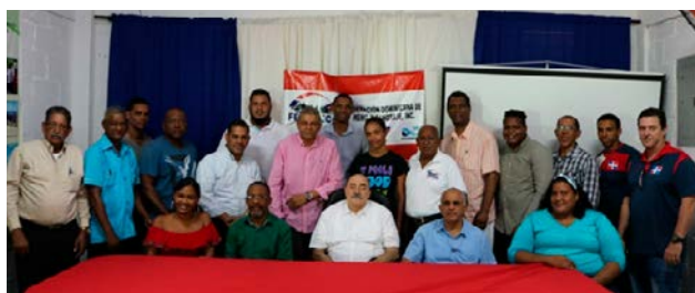
Participantes en la asamblea constitutiva de la federación de Remo.

En cumplimiento con las ordenanzas del Comité Olímpico Internacional (COI), quedó formalmente constituida la Federación Dominicana de Remo (Fedoremo) durante la asamblea celebrada en Bonao.