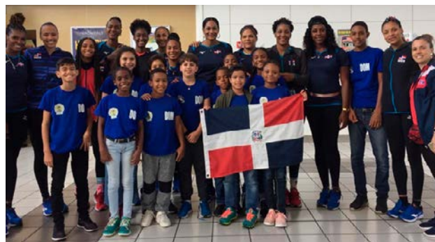
Los infantes de tenis de mesa, junto al equipo de voleibol femenino de voleibol al coincidir en el Aeropuerto.

En la sumatoria total de puntos, el equipo de Brasil se quedó con el primer lugar con 1,690 puntos, la representación de Puerto Rico con el segundo, sumando 1,350 puntos, y Colombia, con el tercero, con 1,090 puntos. 🇩🇴