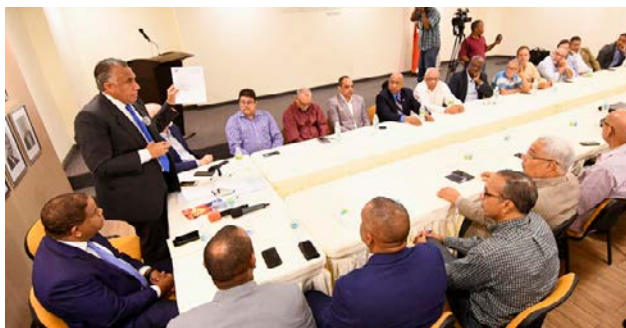
Luis Mejía, presidente del COD, al dar apertura al encuentro federativo con el ministro de Deportes Danilo Díaz.

El ministro de Deportes, Danilo Díaz Vizcaíno, se comprometió con las federaciones deportivas nacionales a mejorar varias de las preocupaciones expuestas durante el XIII Conversatorio Federativo celebrado este lunes en la sede del Ministerio de Deportes.