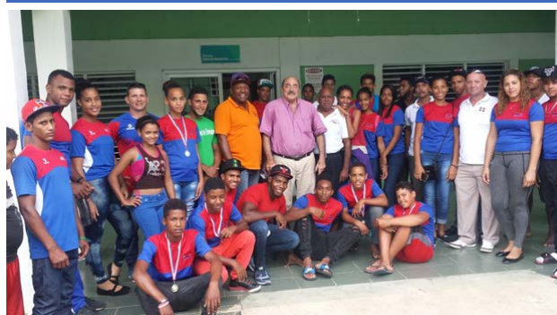
Directivos de FEDORECA junto a los atletas del seleccionado nacional y nuevos talentos.

La Federación Dominicana de Remo y Canotaje (FEDORECA), celebró una convivencia con los atletas de las selecciones nacionales y los nuevos talentos a los que motivó y trazó líneas generales sobre el nuevo ciclo Olímpico y los trabajos de la organización.