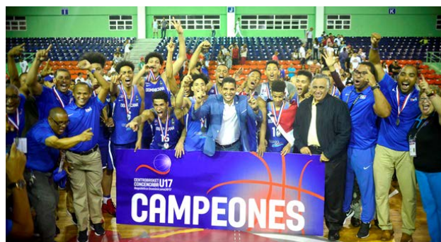
Equipo masculino sub-17 que ganó la medalla de oro en el Centrobasket.

Asimismo, el COD extendió una felicitación a la Federación Dominicana de Baloncesto y en particular a todos los integrantes del equipo masculino Sub-17 y todo su cuerpo técnico, por haber obtenido la medalla de oro y consecuentemente el título de campeón del Centrobasket masculino Sub 17.