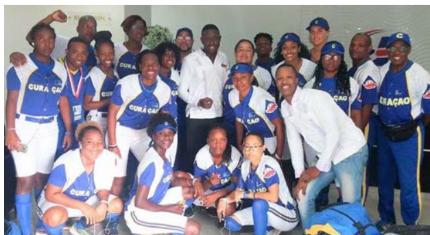
El seleccionado de softbol de Curazao está hospedado en el Albergue Olímpico.

Desde que comenzó a operar el pasado 24 de febrero del presente año, el Albergue Olímpico ha recibido todo tipo de elogios por parte de atletas y dirigentes deportivos de diferentes países que han tenido la oportunidad de disfrutar de su hospitalidad.