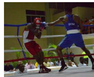
Ambos eventos se mantienen en el calendario deportivo dominicano.