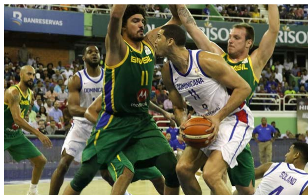
El equipo dominicano clasificó como cuarto mejor lugar del clasificatorio.

Los brasileños también fueron superiores en la pintura, con un 62.1 por ciento (18-29), contra un 48.7 (19-39) de República Dominicana, que también jugó mejor en puntos en bolas perdidas 25-15, pero la banca de los visitantes dominó 33-25. 🏀