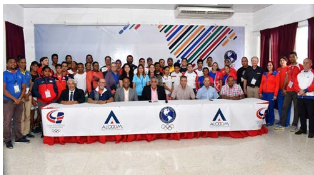
Participantes en el Campamento de Arquería, junto a directos de la Fedota y autoridades del COD, así como representantes de Panam Sports.

El encuentro reúne a representantes de Chile, Ecuador, El Salvador, Paraguay, Perú, Guatemala, Barbados, Trinidad & Tobago, Cuba y República Dominicana. 🇩🇴