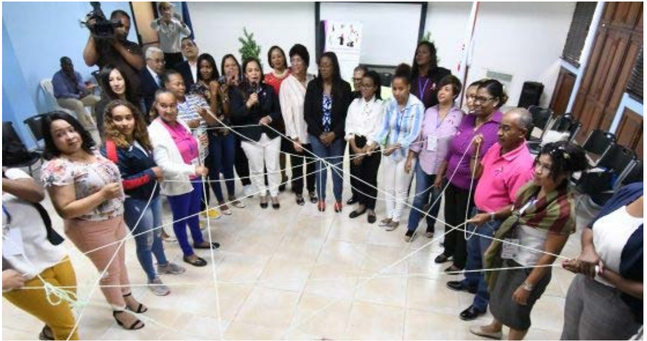
Un grupo de mujeres, acompañadas por algunos hombres, en una de las dinámicas celebradas durante la celebración del seminario “Empoderamiento de la Mujer en el Deporte”.