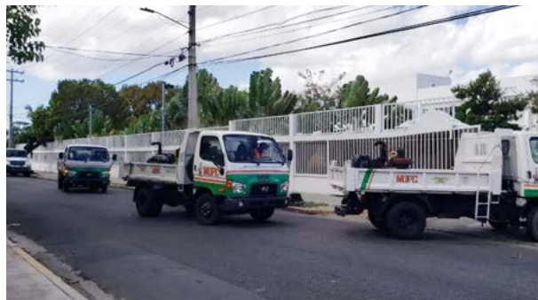
Camiones del MOPC en la jornada de fumigación en el Albergue Olímpico.

Estas medidas se producen en momentos que el COVID-19 ha provocado una crisis sanitaria a nivel mundial y que afecta a la República Dominicana. El anuncio fue hecho durante una reunión con todo el personal de ese establecimiento, así como con atletas y entrenadores allí hospedados, en la que también estuvieron miembros del Comité Ejecutivo del COD y de la administración del Albergue Olímpico. “Estamos disponiendo el cierre de las puertas para proteger a