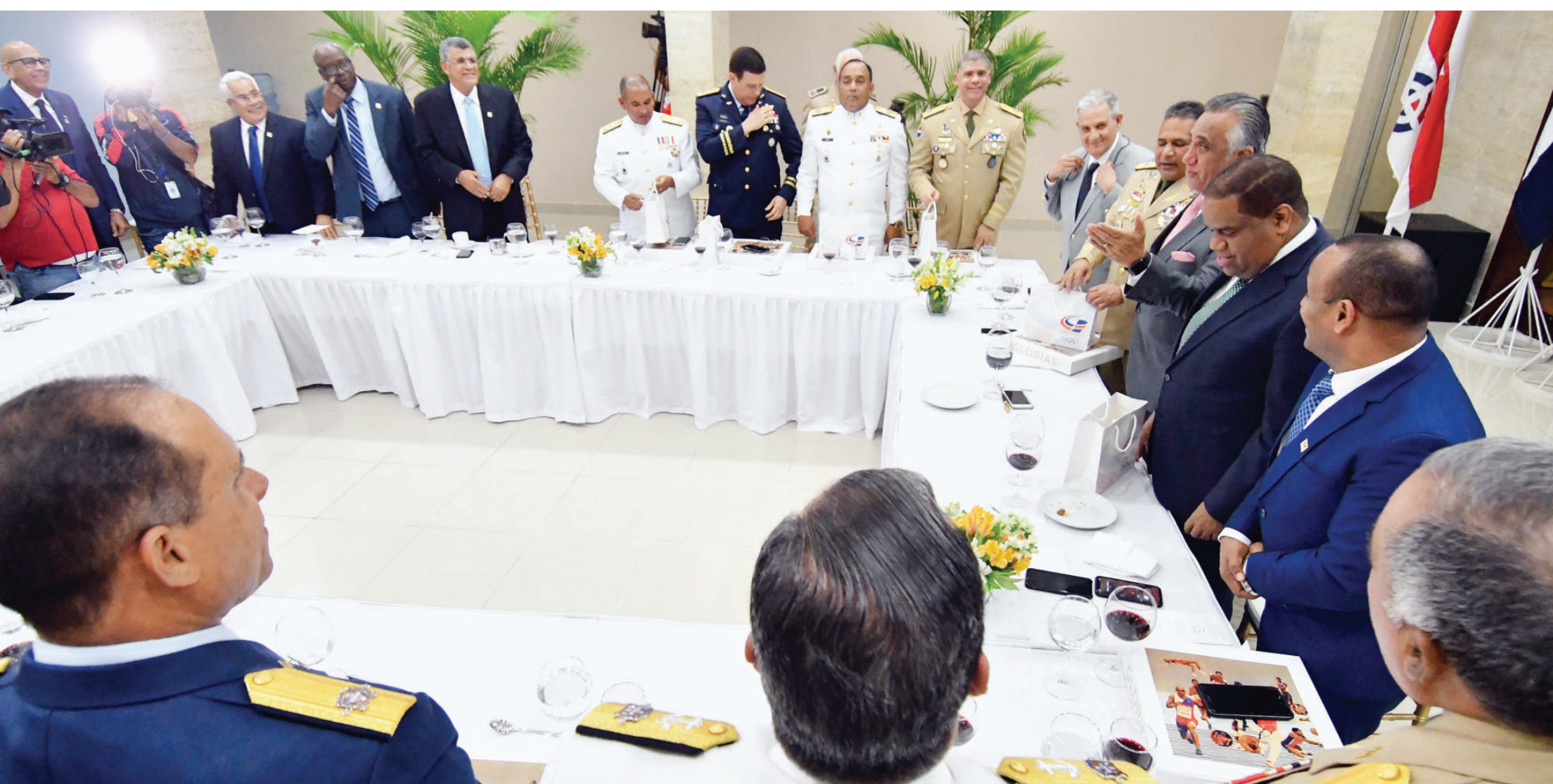
Participantes del almuerzo con los altos mandos Militares y Policiales invitados por el Comité ejecutivo del COD. También estuvo como invitado el licenciado Danilo Díaz, Ministro de Deportes y dirigentes federados.