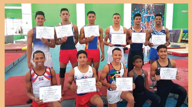
Las atletas integrantes del Grupo A, momento después de haber recibido sus respectivos pergaminos.

“Contamos con ustedes. En tres años podrán estar listas para los próximos Juegos Centroamericanos”,