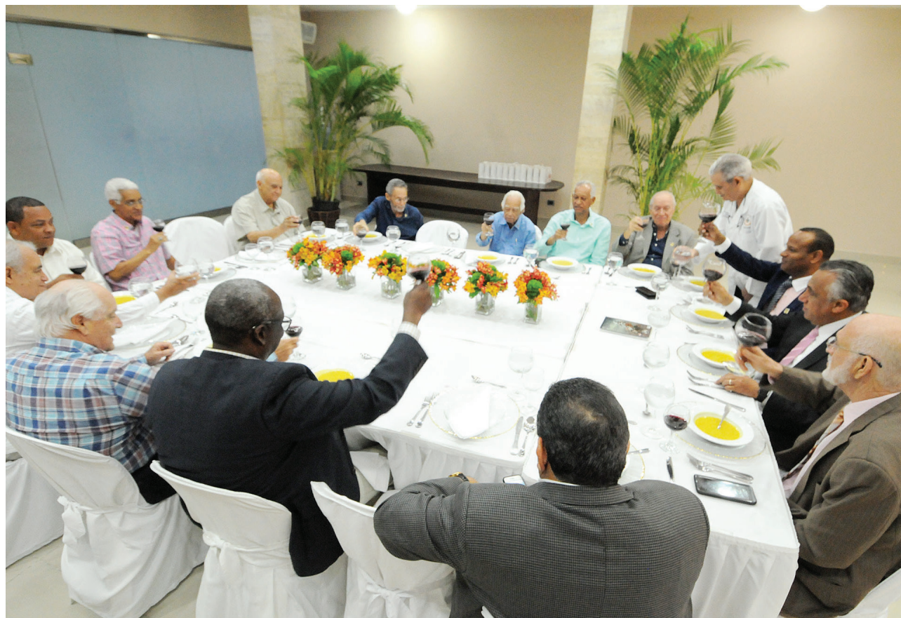
Un ameno encuentro de los miembros del Comité Ejecutivo del COD con veteranos dirigentes olímpicos.