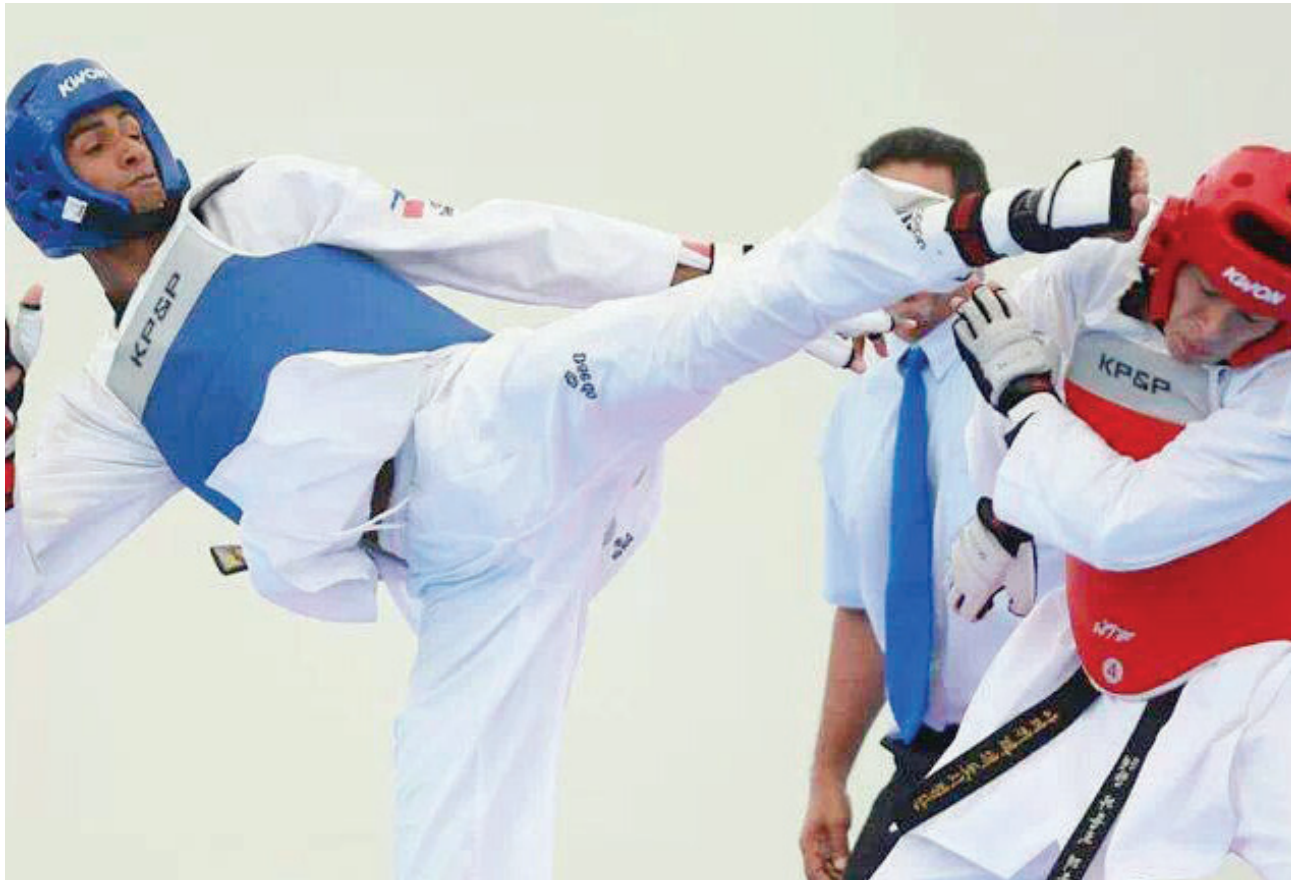
El dominicano Moises Hernández tuvo una gran actuación en el Campeonato Mundial de Taekwondo.

El dominicano Moisés Hernández ganó la medalla de bronce en el Mundial de Taekwondo celebrado en la ciudad de Manchester, en Inglaterra.