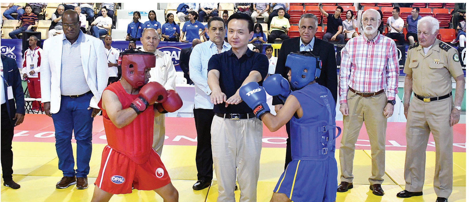
Uno de los combates celebrados durante la celebración del torneo Ranking de Campeones de Wushu-Sanda.