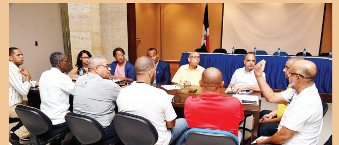
Una de las sesiones de trabajo de cara a Lima 2019.

El Albergue Olímpico comenzó a recibir atletas de las disciplinas de atletismo, bádminton, balonmano femenino, baloncesto 3x3, boxeo, judo, lucha olímpica, pentatlón moderno, surf, taekwondo, tenis de mesa, triatlón, vela y voleibol playa.