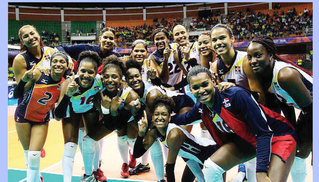
Las Reinas del Caribe van a otra gran competencia internacional en busca de la gloria.

En los Juegos Panamericanos 2015, el voleibol femenino de la República Dominicana alcanzó medalla de bronce. Para Lima 2019, la meta es mantenerse en el podio.