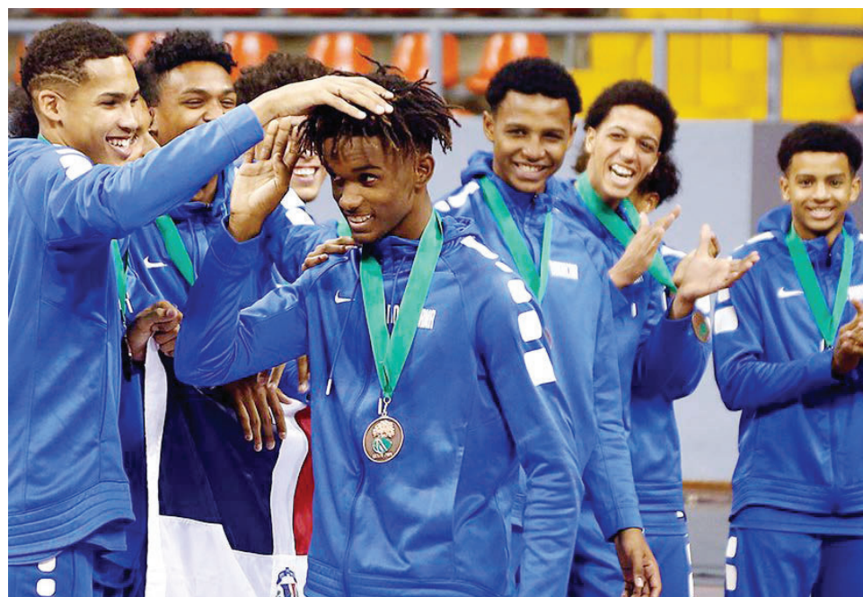
El baloncesto dominicano sigue alcanzando logros a nivel internacional.

Puerto Rico, Estados Unidos, Islas Vírgenes y Venezuela son