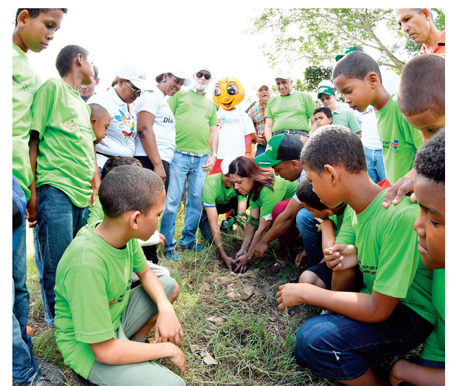
El Comité Olímpico Dominicano ha sido un impulsor del medio ambiente.

La celebración del Día Mundial del Medio Ambiente, el 5 de junio, está dedicada