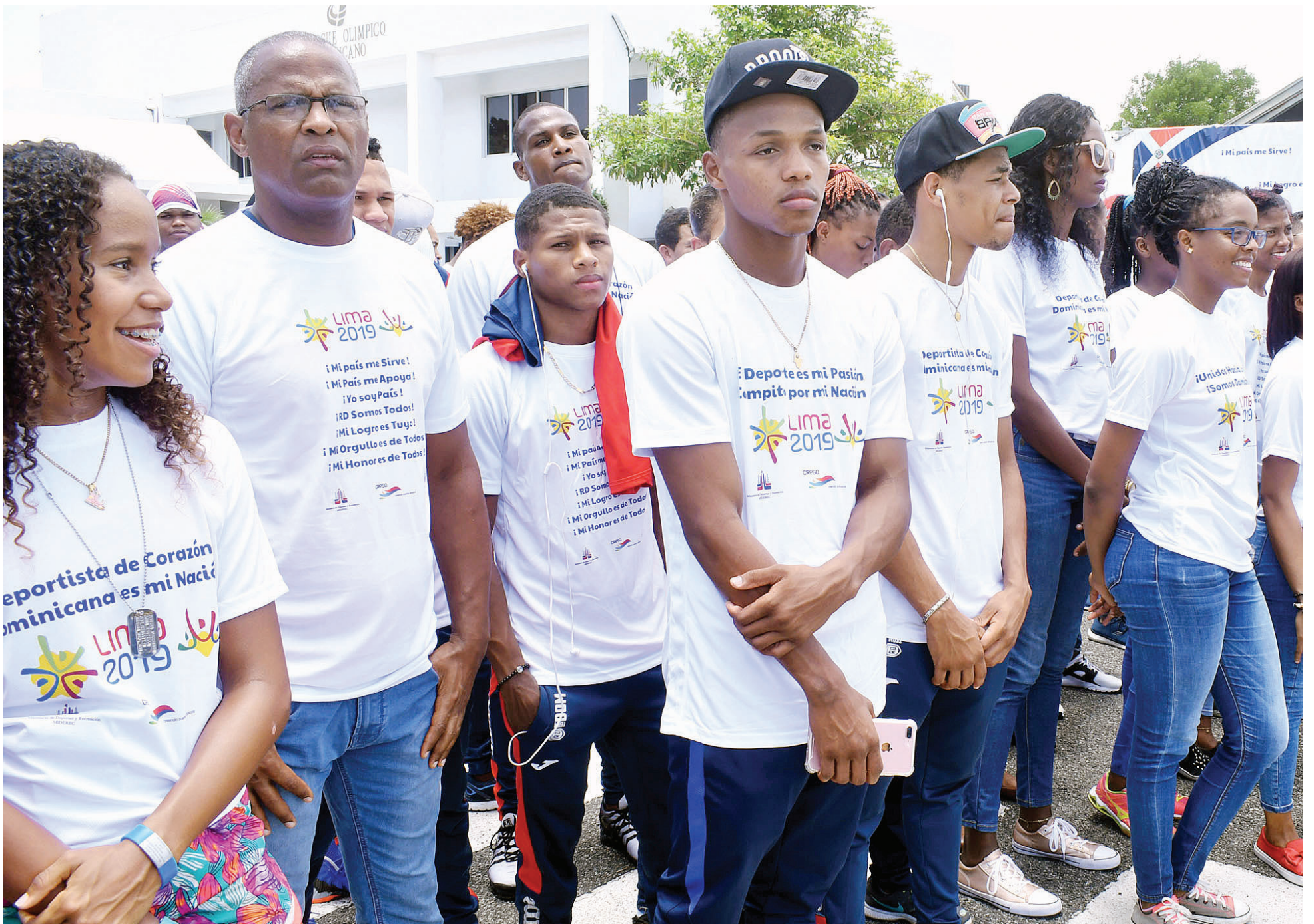
Parte de los atletas y entrenadores alojados en el Albergue Olímpico con motivo de los próximos Juegos Panamericanos de Lima 2019.

POR PRIMERA VEZ EN MUCHOS AÑOS LOS DEPORTISTAS SON REUNIDOS EN UN MISMO LUGAR