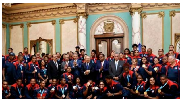
La delegación dominicana fue recibida por el presidente Danilo Medina luego de su éxito en los panamericanos de Lima.

El Comité Olímpico Dominicano (COD), cierra el 2019 una amplia gama de logros en el orden atlético, dirigencial e institucional y augura un 2020 excelente con el que espera cerrar uno de sus mejores Ciclos Olímpicos de la historia.