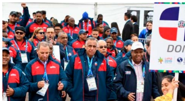
Parte de la delegación dominicana durante el desfile en la ceremonia de apertura de la cita multideportiva en Lima, Perú.

Da crédito al trabajo mancomunado llevado a cabo con el Estado