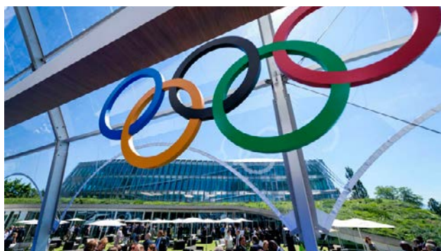
Los candidatos para obtener la sede de la justa serán invitados de manera anticipada.

La candidatura de Milán y Cortina d’Ampezzo, en el norte de Italia, venció a la oferta sueca de Estocolmo-Are, que también incluía una pista de bobsled en Letonia, en una campaña donde el apoyo de los gobiernos nacionales y estatales fue inconstante. Los futuros candidatos para ser sedes de unos Juegos Olímpicos deberán utilizar recintos e infraestructura que ya existan o que sean temporales, alejándose de los costosos proyectos de construcción. 🗳️