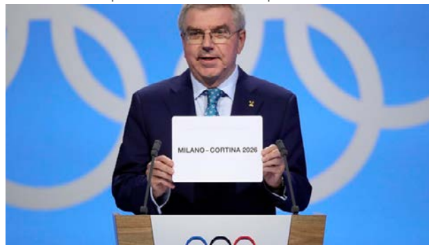
Thomas Bach, presidente del Comité Olímpico Internacional (COI).

El rival era duro. Suecia es un país en crecimiento económico y que se ha presentado siete veces sin haber obtenido nunca los juegos invernales. También tiene una política de integración que hacía más fácil su misión de convencer a los indecisos. Pero al final la victoria quedó en el sur de Europa. 🇮🇹