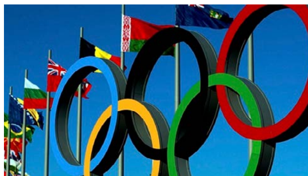
Ambas entidades trabajarán a partir del marco suscrito en el acuerdo internacional.

Uno de los objetivos de la colaboración es orientar a los organizadores de los Juegos Olímpicos de París 2024 a evitar los riesgos de corrupción en las adquisiciones. Estas directrices también se utilizarán en futuros eventos olímpicos con el mismo propósito. 🗳️