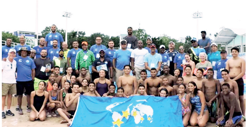
Parte de los entrenadores que participaron en el curso junto a nadadores de diferentes especialidades.

La parte teórica del curso fue celebrada en los salones del Comité Olímpico Dominicano y la práctica en el Complejo Acuático del Centro Olímpico Juan