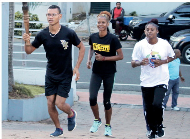
La antorcha de los Juegos Deportivos de las Fuerzas Armadas fue recibida en la sede del Comité Olímpico Dominicano.

nismo olímpico, destacó que los juegos también promueven salud, bienestar social y desarrollo integral de las personas.