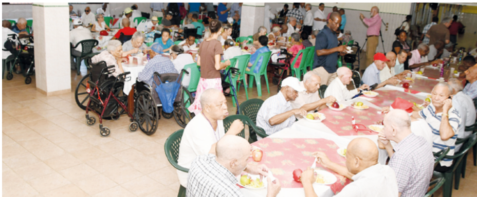
Envejecientes del hogar de ancianos San Francisco de Asís disfrutan de la tradicional Encuentro Navideño que les ofreció el Comité Olímpico Dominicano.

La Madre Superiora del Asilo de Ancianos San Francisco de Asís consideró que la obra que realiza el Comité Olímpico Dominicano (COD) a favor de los envejecientes del lugar quedará para la posteridad. P8-9