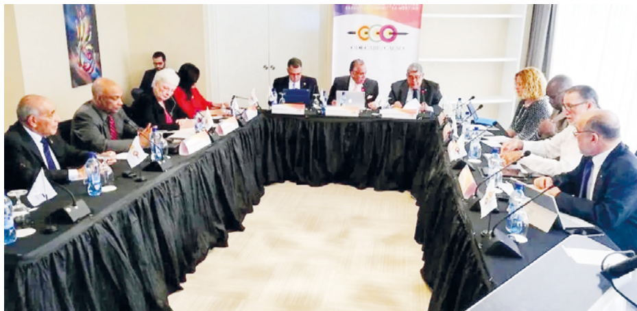
Una sesión del Comité Ejecutivo de la Organización Deportiva Centroamericana y del Caribe.

El Comité Ejecutivo también estableció que el 31 de enero de 2020 es la fecha límite para la presentación de candidaturas de ciudades para albergar los Juegos Centroamericanos y del Caribe 2026 y los Juegos de Playa 2021. Para ambos eventos ya hay ciudades postulantes; en el primer