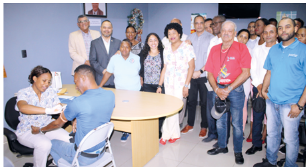
La comisión Mujer y Deportes del COD y ProFamilia trabajaron de la mano en el operativo médico.

La Comisión Mujer y Deportes del Comité Olímpico Dominicano y Profamilia culminaron la primera etapa del programa de prevención de enfermedades llevado a cabo con las federaciones