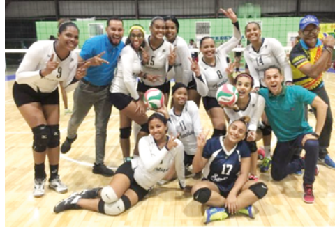
Equipo campeón de la Copa Cibao de Voleibol superior.