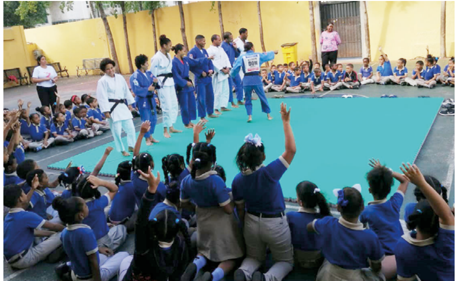
Alumnos de la escuela Mauricio Báez participan de la exhibición de judo.

cer las técnicas del judo en distintos centros educativos para motivar a que los estudiantes puedan tener una opción como deporte”, manifes-