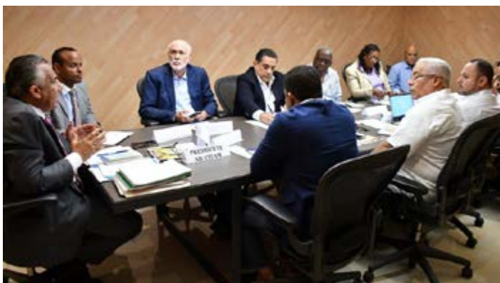
Comité ejecutivo del COD en plena reunión. (archivo).

El Comité Ejecutivo del Comité Olímpico Dominicano (COD) resolvió este martes solicitar la posposición de la desescalada de los entrenamientos de los deportes olímpicos bajo techo hasta el mes de agosto por el incremento de infectados de COVID-19 que se ha producido en los últimos días.