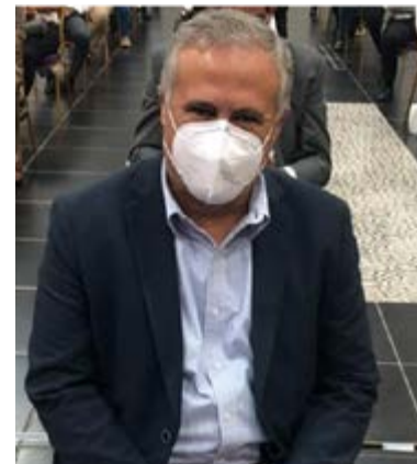
Doctor Pedro Domínguez Brito, presidente de la FDA.

La Olimpiada de Ajedrez se realiza cada dos años y reúne a selecciones de más de 100 países que compiten en dos categorías: absoluta y femenina, este año se estará celebrando de una manera especial y los equipos estarán conformados de manera mixta.