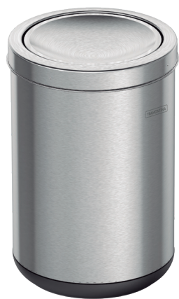
Ref.: 94540/022 10 L