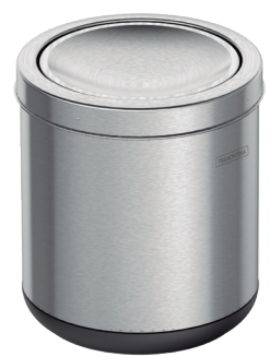
Ref.: 94540/020 7 L