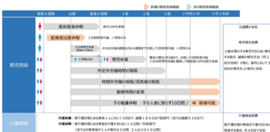
鉄建建設の両立支援制度

当社では、社員のワークライフバランスを大切に考え、社員が育児や介護等をしながらも、安心して働き続けられるよう各種両立支援制度の充実化に取り組んでいます。なかでも、男性社員の育児休業取得促進に向けた取り組みを積極的に行っており、育児休業を1か月まで有給としているほか、対象の子が2歳になるまで特別な事由がなくとも育児休業を取得できるなど、法定を上回る制度を導入しています。また、eラーニングやWEB社内報を通じた周知啓発も継続的に実施しており、男性社員の育児休業取得率は年々上昇しています。さらなる制度の利用促進を図るため、2022年4月には、「育児休業意向確認面談システム」を導入し、育児期社員への制度周知、上司による育児休業取得意向の確認、フォロー体制整備のための情報共有など、一連の流れをシステム化しました。今後も引き続き、誰もがワークとライフを両立できる職場環境づくりを推進していきます。