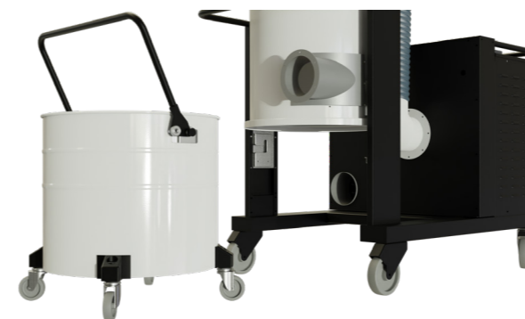
Sistema agevole di sgancio del fusto