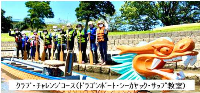
クラブ・チャレンジコース(ドラゴンボート・シーカヤック・サップ教室)