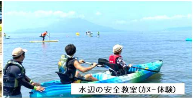
水辺の安全教室(カヌー体験)