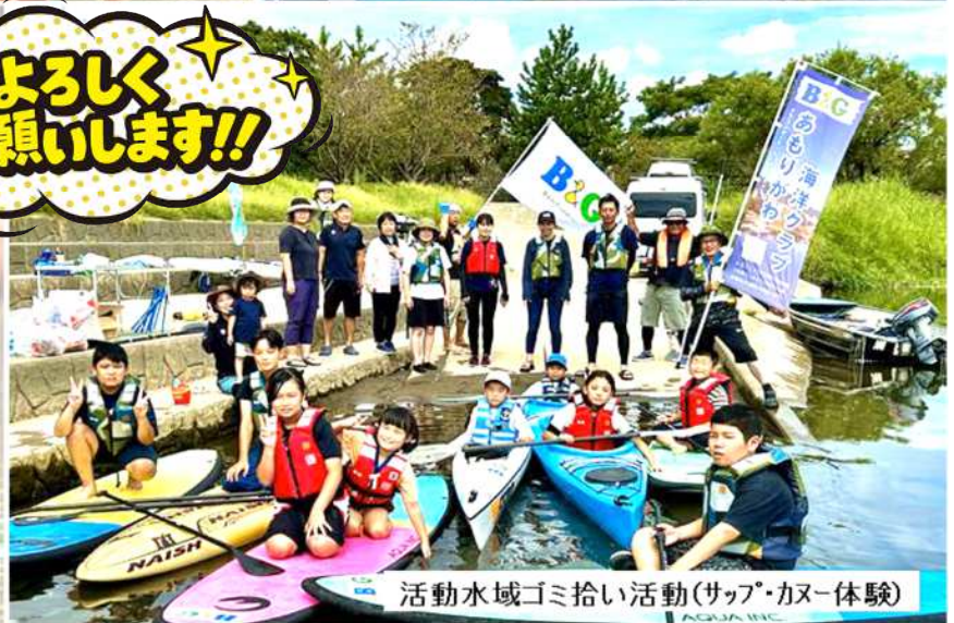
活動水域ゴミ拾い活動(サップ・カヌー体験)

日頃より、B&Gあもりがわ海洋クラブの活動に対しご支援を頂き、誠にありがとうございます。この度の物品販売によります収益金は、クラブの活動資金として大切に活用させていただきますので、ご協力をよろしくお願い致します。 クラブ一同