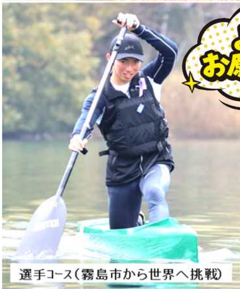
選手コース(霧島市から世界へ挑戦)