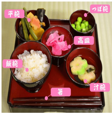
↓ 仏様側にご飯がくるように

法事やお盆・お彼岸の時に、特別にお膳を供えることを、霊供とい、飯椀(ご飯)・汁椀(味噌汁)・壺椀(煮豆類)・平椀(煮物類)・高皿(和え物・漬物など)の五種類を供え、箸は仏様の方に向けておきます。飯食は精進物とします。 迎え火と送り火 十三日の夕方に、門口でご先祖さまの御精霊を迎える火を焚き、送り火は十五日の夜に焚きます。