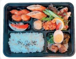
B1 アジアン 幕の内弁当 ¥1,800