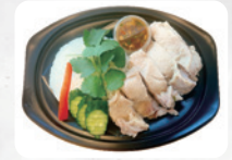
G1 カオマンガイ ¥990