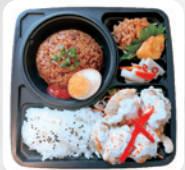
A2 インドネシア弁当 ナシゴレン&アヤムゴレン