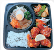
A3 韓国弁当 A ビビンバ&ヤンニョムチキン