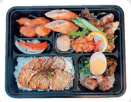
B2 牛カルビアジアン 幕の内弁当 ¥2,500