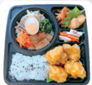
A4 韓国弁当 B ビビンバ&ハニーマスタードチキン