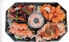
◆プレートA H1 スモール(2~3人前) ¥2,950 H2 ラージ(4~5人前) ¥5,450