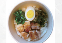
G4 台湾ルーロー飯 ※ ¥830