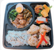
A1 台湾弁当 ※ ルーロー飯&台湾唐揚げ