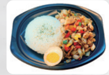
G2 角切り肉の ガバオライス ¥930