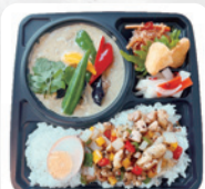
A5 タイ弁当 A ※ ガバオライス&グリーンカレー