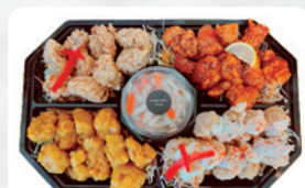
◆プレートC H5 スモール(2~3人前) ¥2,960 H6 ラージ(4~5人前) ¥5,470