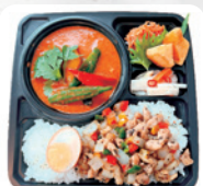
A6 タイ弁当 B ※ ガバオライス&レッドカレー