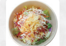
G5 アジアンタコライス ¥850 G6 アジアンスパイシー タコライス ¥900