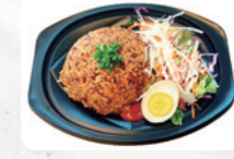
G3 ナシゴレン ¥900