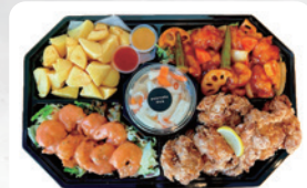
◆プレートB H3 スモール(2~3人前) ¥2,840 H4 ラージ(4~5人前) ¥5,230