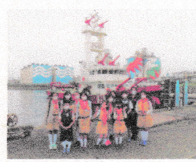
令和5年度(2023年) 活動予定