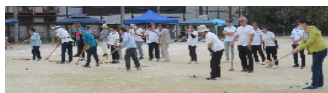
ホールインワンチャレンジ