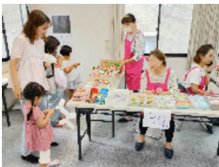
ワクワクショッピング