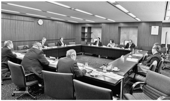
3月13日に全国生衛会館で開かれた正副会長会議

全社連の令和5年度正副会長会議は、第5回を2月7日、沖縄県組合の事務所、総務部長、経理部長などが出席した。第6回は3月13日に東京の全国生衛会館で開催。正副会長、執行部(専務理事、総務部長、経理部長)などが出席した。