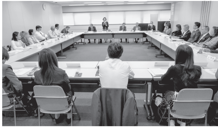
都道府県組合の事務局関係者が出席した会議

全社連の事務局会議が4月12日午後1時から全国衛生会館で行われ、全国38都道府県組合のうち22組合の事務局関係者が出席した。昨年に続き、2回目の会議で、全社連が取り組む厚生労働省の令和5年度補正予算事業「令和6年度税制改正（交際費・飲食費）の周知徹底による売上アップ・経営改善支援事業」や組織拡大などの説明を受け、理解を深めると共に、各県組合の近況などを報告し合い、全社連と各組合及び組合間の連携を強めた。