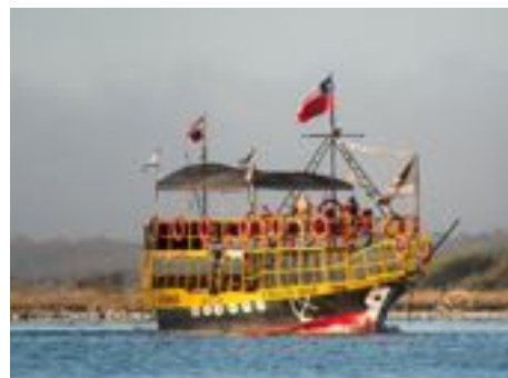
Paseo en bote por el Río Maule