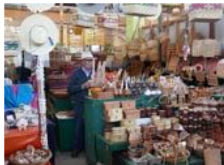
Mercado de Constitución