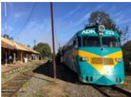
Tren Ramal Constitución