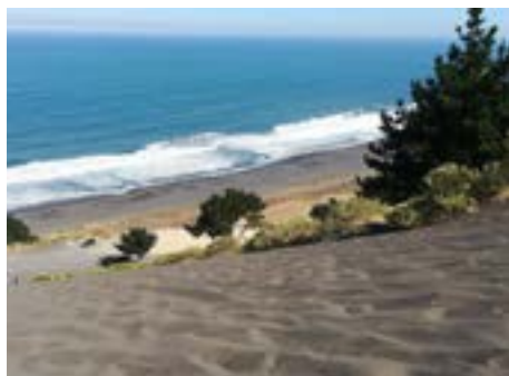
Cerro de Arena