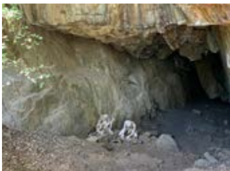
Cuevas de Quivolgo