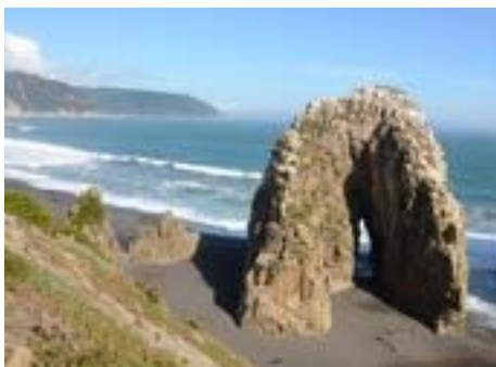
Piedra de la Iglesia y formaciones rocosas

En las cercanías de la ciudad destacan también las dunas y humedales de Putú , que conforman el campo de dunas más extenso del país, ideales para la práctica del ecoturismo.