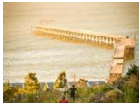
Balneario de Iloca y Caleta Duao