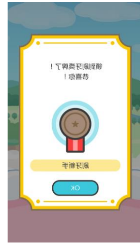
收集「刷牙獎牌」，成為「刷牙大師」！