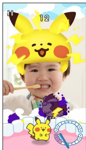
畫面上會出現被「蛀牙菌」捉住的寶可夢。