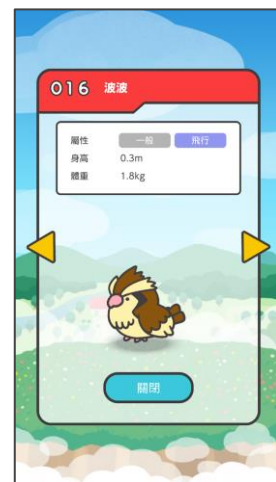
捉到的寶可夢會被登錄到「寶可夢圖鑑」。