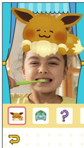
戴上「寶可夢帽帽」來享受刷牙的樂趣吧。