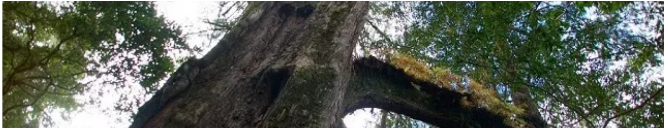
檜木神靈：與森林共存的原住民部落