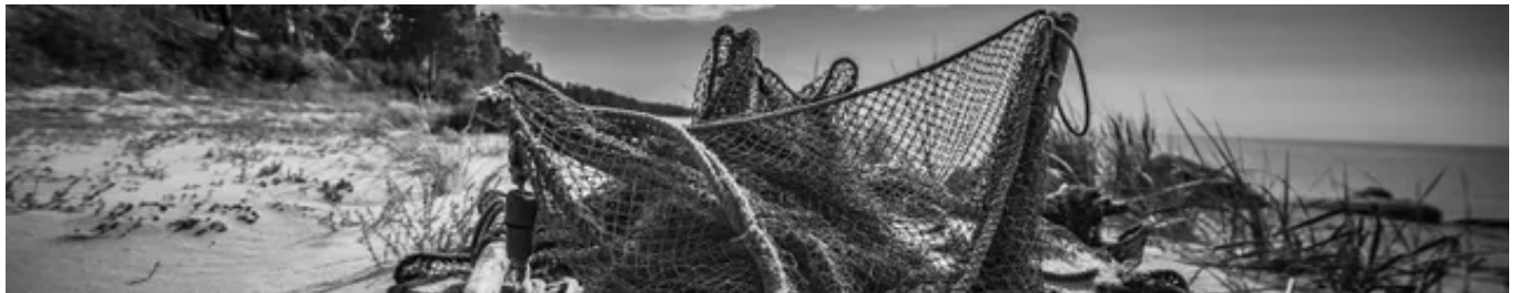
漁的大歷史：近200萬年的捕魚行為，如何促進人類文明？