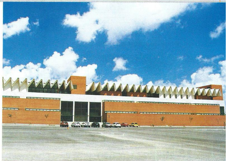
AMF Proyecto en la Universidad de Elche, Alicante (España)