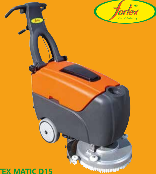
FORTEX MATIC D15

PRODER obtient de la combinaison d'une rigoureuse sélection des meilleures matières premières, de notre expérience et notre laboratoire d'I+D+I, la meilleure gamme du marché de produits, de systèmes et de services pour le traitement de n'importe quelle surface, avec les meilleurs résultats de durabilité, qualité et rentabilité.