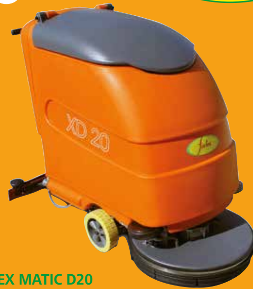
FORTEX MATIC D20

PRODER réussit à faire agréable la tâche quotidienne d'entretenir les sols à la paire qu'obtenir le meilleur rendement, résultats et rentabilité, avec sa gamme de produits et de systèmes pour l'entretien quotidien des sols.