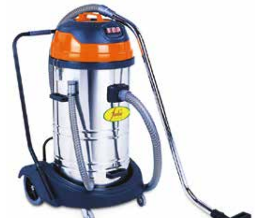
VACUUM 3 WET/DRY

Pad pulido Pad polimentado / Pad de polissage