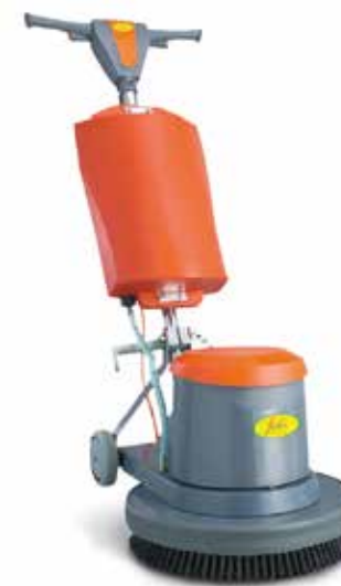
FORTEX BRILL 20