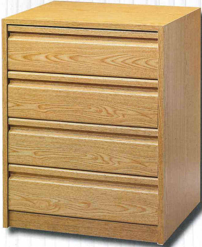
CAJÓN DE 16 CM.