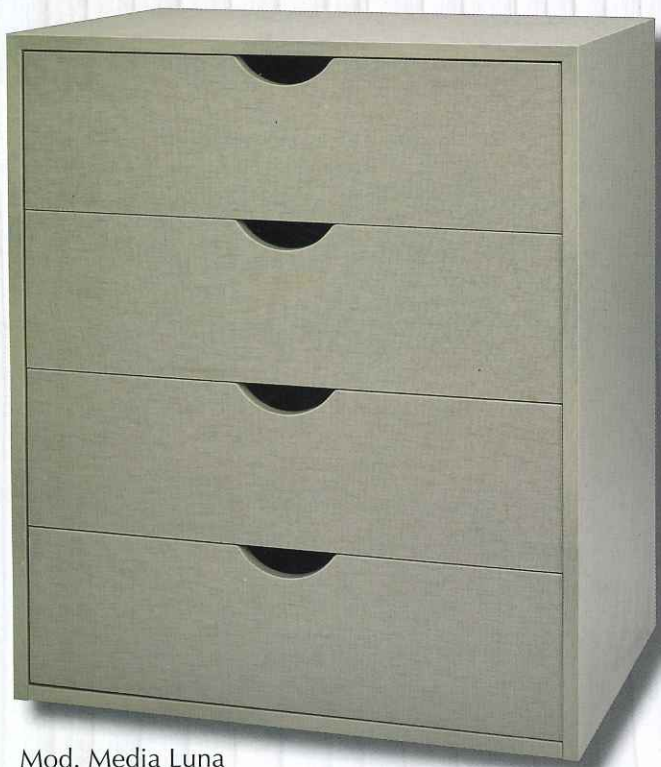
Mod. Media Luna cajón de 20 cm. Color Lino Capuchino Textil