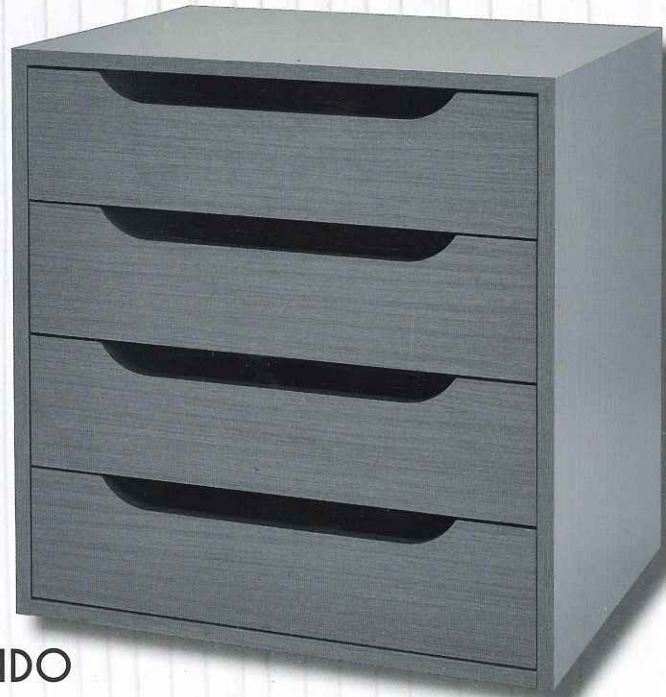
Mod. Góndola cajón de 16 cm. color Roble Renovaes