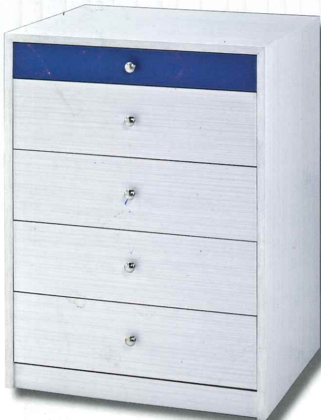
Mod. Liso el tirador es opcional y puede ser redondo, cuadrado o embutido, color Ártico y cajón de 8 cm. En Azul Handy.