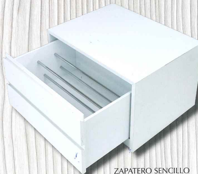
ZAPATERO SENCILLO Mod. BOX Estracción total

ZAPATERO SENCILLO Más 1 cajón de 16 cm. Modelo Atenas Tablex. Línea 2001