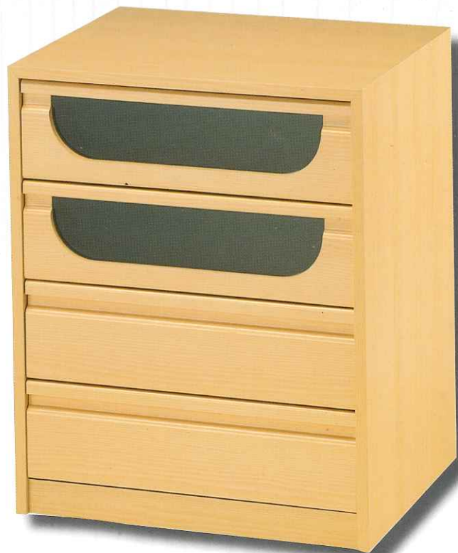
Cajonera combinada Canoe mate/Postformado