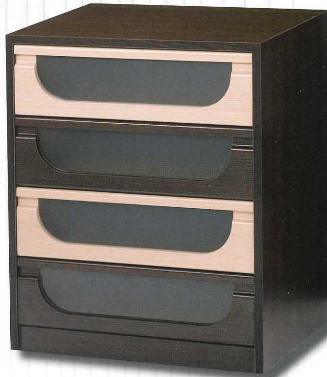
Mod. Canoe mate Color Wengué combinado con Haya C