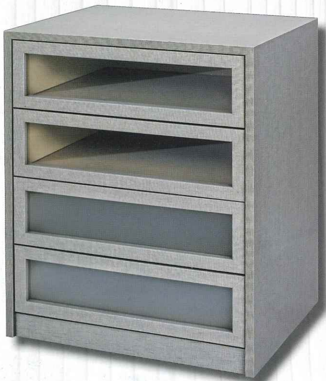
Mod. Atenas mate y transparente Color Lino Capuchino