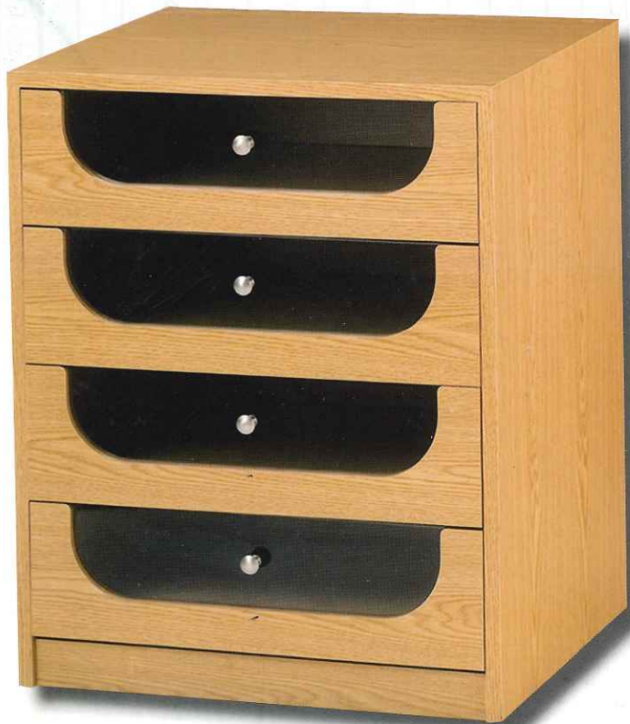
Mod. Oasis transparente, con tirador.