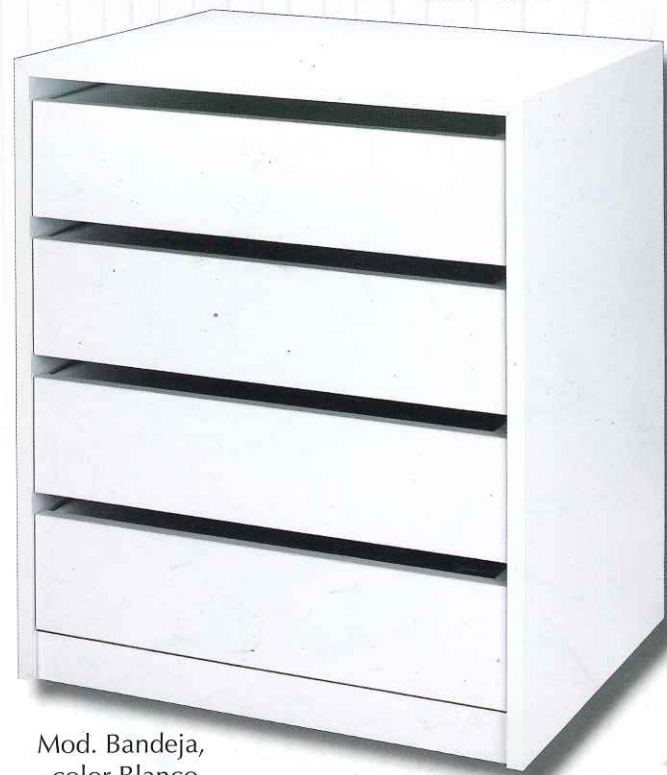
Mod. Bandeja, color Blanco.