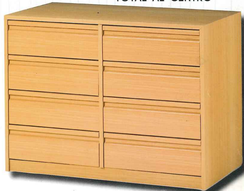
CAJONERA CON DIVISIÓN TOTAL AL CENTRO