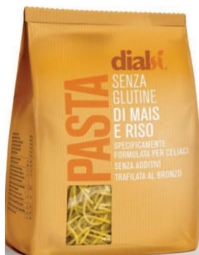
Filini 300 g (Fideo grueso)