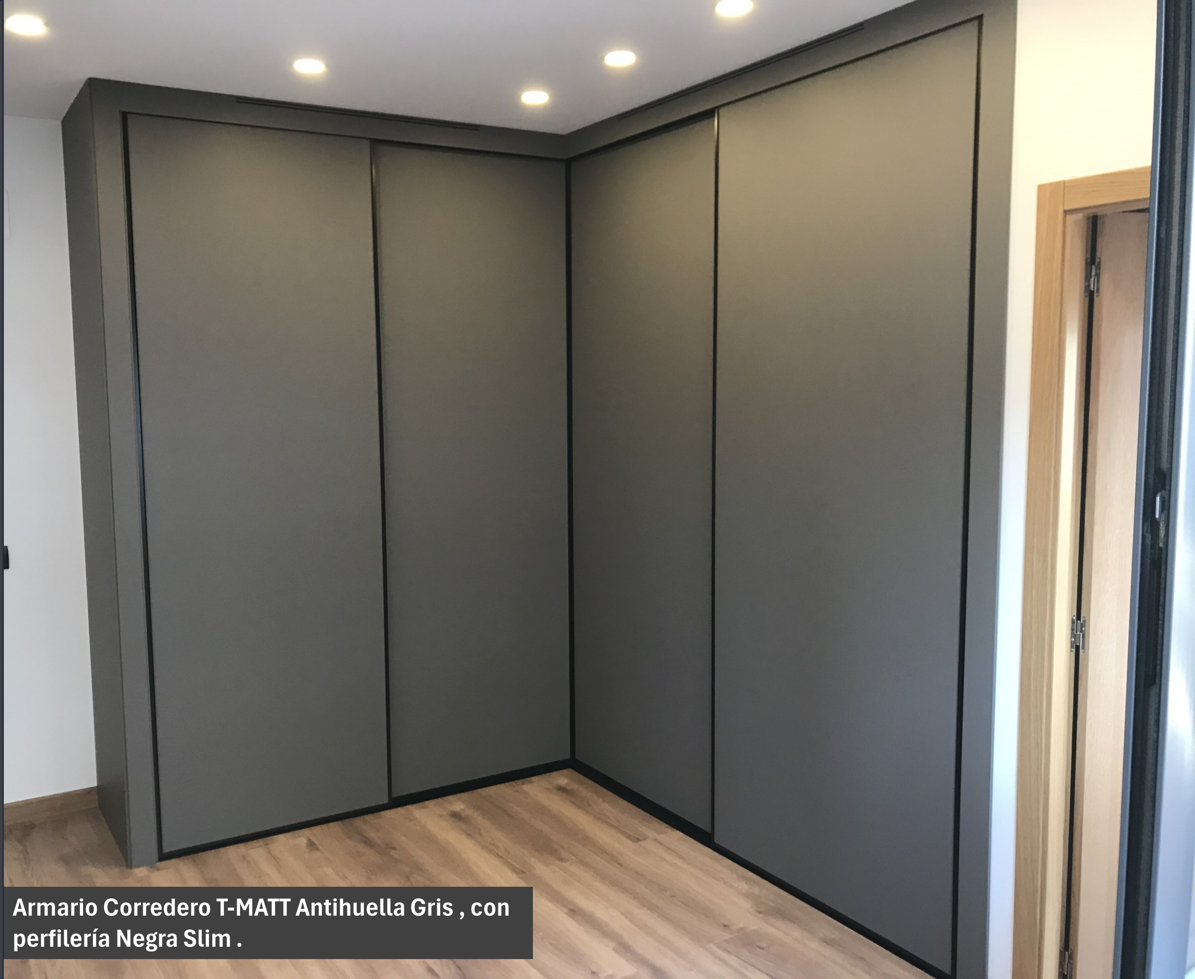
Armario Corredero T-MATT Antihuella Gris , con perfilería Negra Slim .