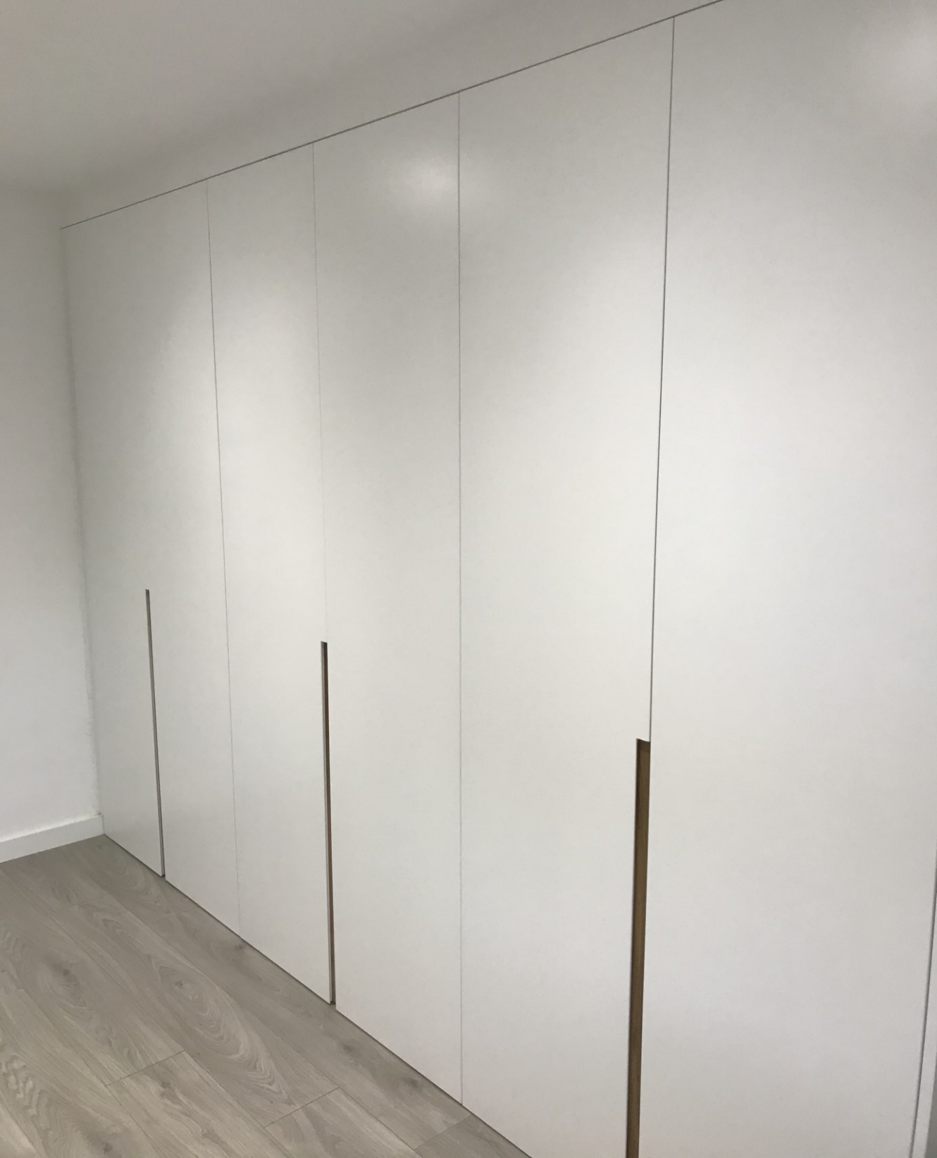
Armariada LACADA BLANCO con tirador embutido de madera maciza de ROBLE pulimentado.