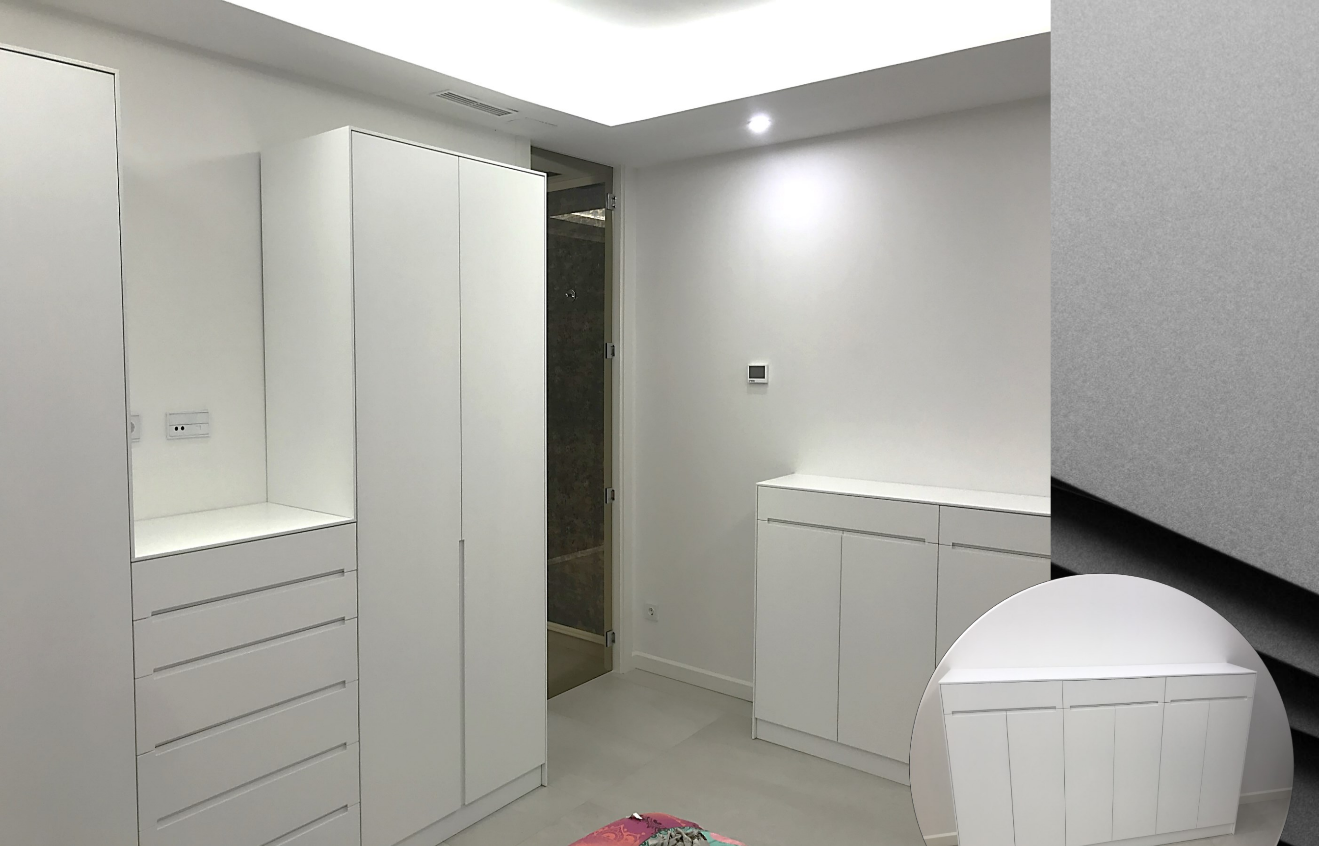
Conjunto de Armario y Cómoda lacada Blanco Mate con tirador embutido Tokio a juego contorneados con tapas de 10 mm ingletadas.