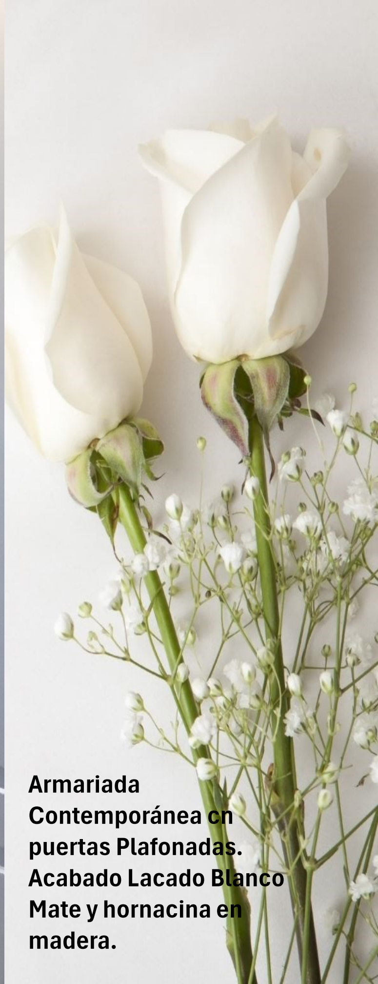
Armariada Contemporánea cn puertas Plafonadas. Acabado Lacado Blanco Mate y hornacina en madera.