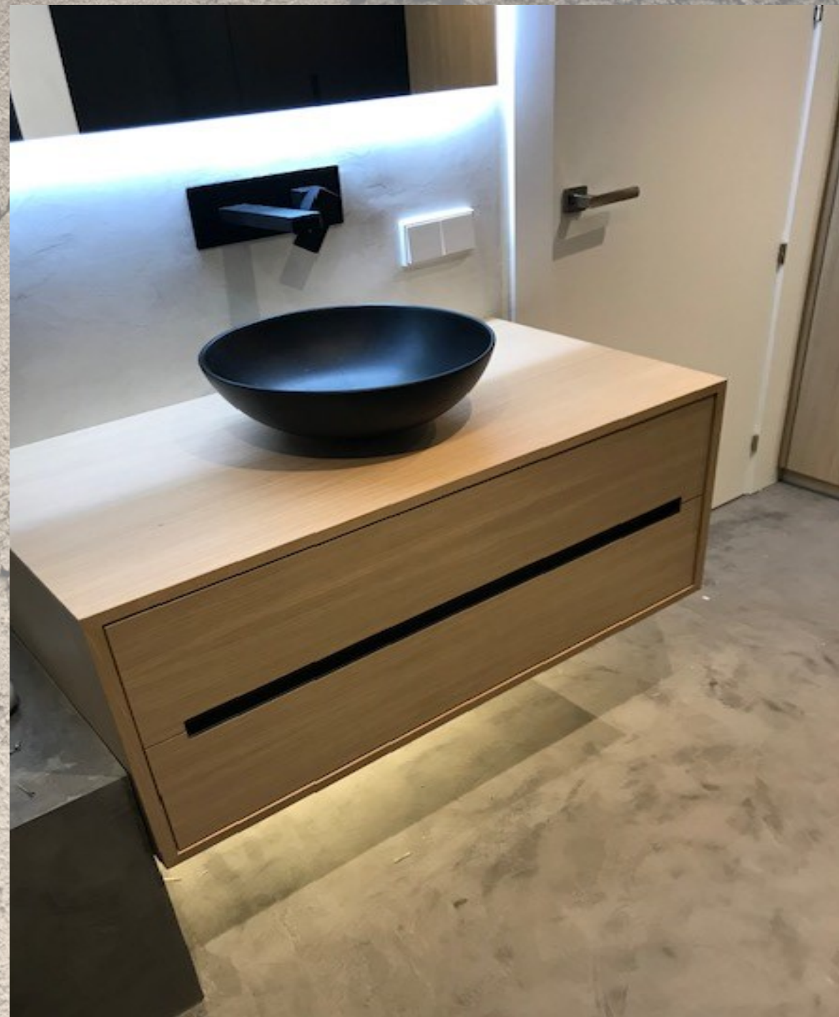
Mueble Baño Suspendido acabado en Roble Natural sobre tablero de MDF de alma Negra con tirador embutido en frentes.