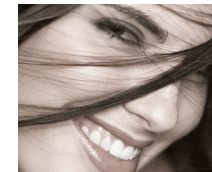
Rostro rejuvenecido. Cara

Los equipos Ellipse han obtenido la marca CE de la Medical Device Directive. La fiabilidad y la calidad están aseguradas a través de largos test clínicos y técnicos de la ISO 9001 y la ISO 13485. También cuentan con la UL 60601 y la QMI.